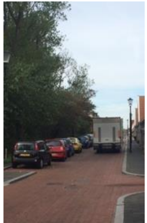
zo min mogelijk 2 richting verkeer op de Meerburgkade

De gemeente Katwijk heeft een woonvisie opgesteld. Deze woonvisie is de basis voor de zogenaamde prestatieafspraken tussen gemeente, SHD en Dunavie. Omdat enkele bewoners hun twijfels hadden of er wel voldoende rekening gehouden werd met de belangen en de zienswijze van de huurders (o.a. ervaringen ontwikkeling Rooie buurt) hebben deze bewoners gebruik gemaakt van